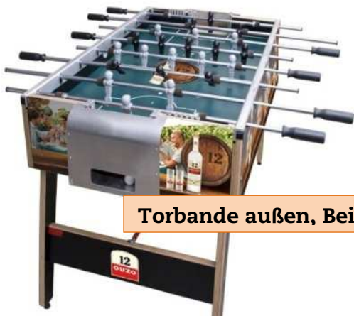
Torbände außen, Bein