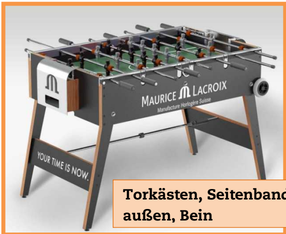
Torkästen, Seitenbände außen, Bein