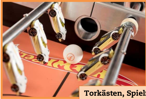
Torkästen, Spielfeld, Figuren, Seitenbände außen, Bein, Korpus-Kanten, Ball